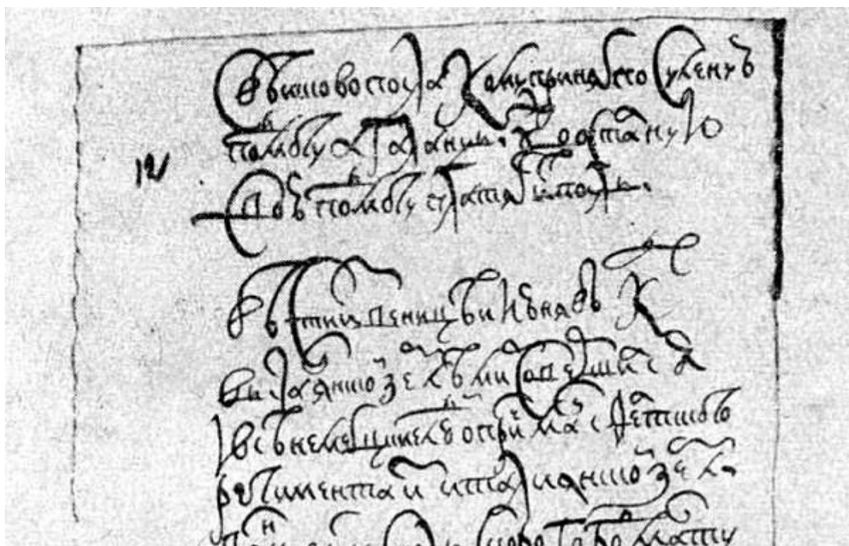
Рис. 3. Рукописные «Куранты».

Газету «Ведомости» в современной отечественной историографии принято называть петровскими, что является еще одним неоспоримым фактом, подтверждающим ранее изложенную концепцию о реформаторской направленности деятельности самодержца.